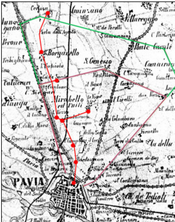
Ricostruzione del percorso del passaggio segreto, tra il Castello e la Certosa di Pavia (sulla base di una cartografia del 1871). La linea rossa indica il tracciato del sotterraneo, gli altri colori indicano i perimetri del Parco Vecchio e del Parco Nuovo.

sono ascrivibili a costruzione dell'età romana.