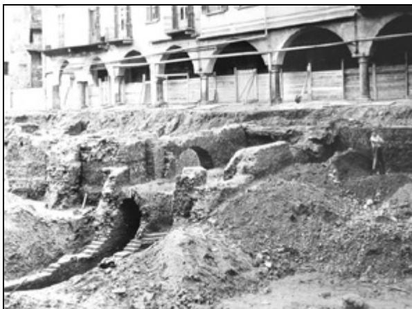
Pavia - Negli scavi compiuti nel 1960 in Piazza Grande, emergono le infrastrutture del sottosuolo: volte di fognature, di condotti e di altri passaggi sotterranei.

I l percorso individuato è l'unico razionalmente plausibile, non solo perché regolarmente scandito da tappe alla distanza relativa d'un miglio, la cui esistenza risale almeno all'epoca viscontea, ma perché evita accortamente ogni avvallamento ed ogni corso d'acqua dell'ampio territorio del Parco.