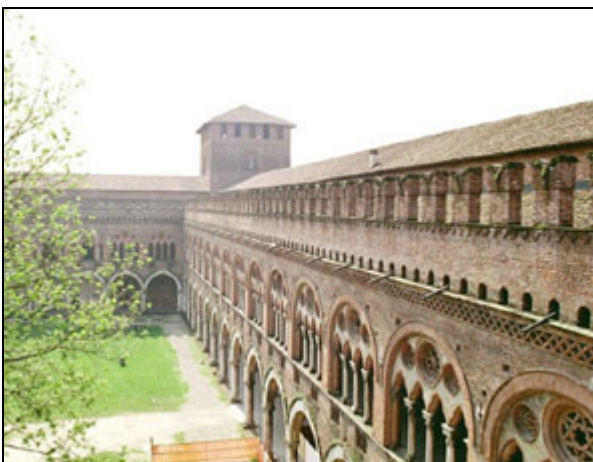
Pavia. Il cortile interno del Castello Visconteo, fatto costruire da Galeazzo Il Visconti (1360-1365) su progetto di Bernardo da Venezia.

quattro gran finestre con le vetriate, ed io l'ho vedute in parte nel suo primiero essere, cioè con i scaloni ed il suolo di marmo, il restante fu distrutto al tempo che fu preso Ludovico Sforza Duca di Milano... Potrei dire molte belle cose del Parco, in cui erano già rinchiusi molti animali, come cervi, Danij e Capriuoli i quali ascendevano al numero di più di cinquemila capi... per le caccie de Signori; le lepri poi, ch'ivi si vedevano, erano senza numero, i Fagiani, Pernici, e quaglie erano spesse come le formiche... v'era un luogo particolare per i conigli, perciò detto la conigliara, e questo era una valle rinchiusa da mura, e un altro chiamato la struzzaria, dove stavano rinchiusi molti struzzi, e un altro serraglio, in cui erano molti orsi, nomato l'orsaria, con un alto muro d'attorno..."