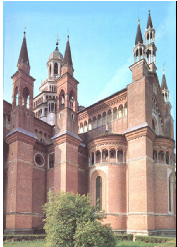
Veduta della zona absidale della Certosa di Pavia (fine sec. XIV).

desiderasse approfondirne la conoscenza, è quindi consigliabile la lettura di tali pubblicazioni. (4)