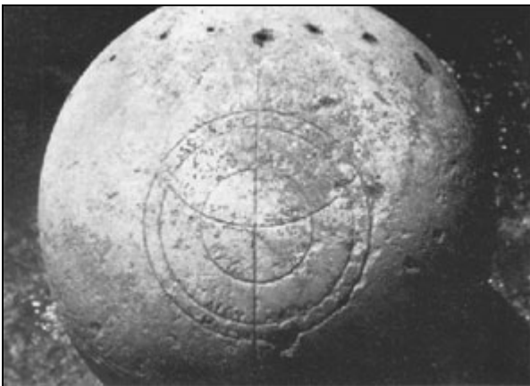
Altra visuale del globo di Matelica

S ulla superficie del globo sono incise due grandi curve: una, di forma circolare, doveva venire a trovarsi in giacitura orizzontale quando la sfera si trovava sul suo sostegno, sul quale la immagineremo durante la seguente trattazione. L'altra, semicircolare e perpendicolare alla prima, si doveva trovare in posizione verticale, a dividere il semiglobo superiore in due quarti di sfera. Per rendere significative le considerazioni che faremo, supporremo che questi due quarti di sfera risultino orientati uno verso est e uno verso ovest. Pertanto le due curve descritte assumono il ruolo di orizzonte, la prima, e di arco meridiano, la seconda.