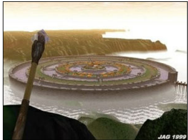
Atlantide. Ricostruzione grafica digitale. Dalla Bryce3D Gallery ( http://home.earthlink.net/~greyson2/Bryce-Art1.htm )

N onostante anni di ricerche e congetture, pur con l'impressione di accostarsi sempre più alla verità, sembra comunque che non si riesca mai a cogliere appieno quel che si cela dietro tale inafferrabile mito, e paradossalmente è proprio questo che ha contribuito per molti a rendere Atlantide stessa simbolo ideale della 'ricerca', costantemente in bilico tra mito e realtà.