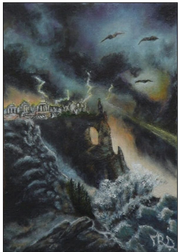
La fine di Atlantide in una ricostruzione pittorica. Maria Rosaria Dragonetti (2003).

C osì, la vasta e definitiva distruzione della potente flotta minoica, provocata da violenti maremoti, si ripercosse in una brusca cessazione dei contatti tra il mondo minoico e l'Egitto. Inoltre la notizia dell'inghiottimento in mare di un'intera isola dovette di sicuro raggiungere molto velocemente l'Egitto. Dunque, secondo Marinatos, non fu difficile che gli Egizi confondessero Creta con Thera, immaginando che la civiltà sommersa non fosse altro che quella della grande isola (Creta) con cui essi avevano improvvisamente perso i contatti(7).