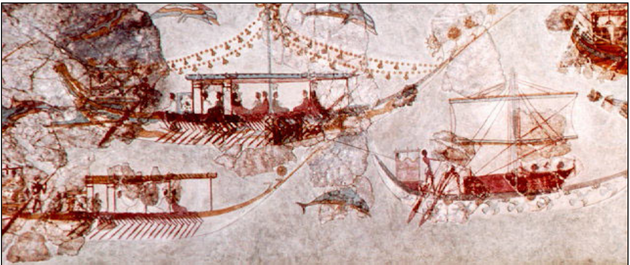
Parte dell'affresco della "Flotta" nella West House, Akrotiri, isola di Thera (da: MARINATOS 1984, fig. 22, p. 40).

P latone, a quanto pare, doveva conoscere tutte le isole all'interno del Mediterraneo, ma le riteneva troppo piccole per essere in grado di organizzare un'invasione delle proporzioni richieste. Di conseguenza l'Atlantide, isola capitale dell'impero marittimo, dovette essere ingrandita a un punto tale da non trovare più spazio all'interno dello Stretto, per cui si ritenne necessario porla fuori nell'oceano, oltre le Colonne d'Ercole (10).